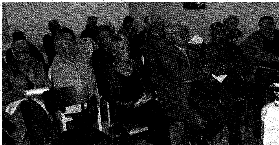
Les bénévoles attentifs aux propos des responsables

Ouvert depuis 1999, il est installé rue de la Touques et accueille plus de 300 bénéficiaires, soit environ 1 400 repas servis par semaine. Une quarantaine de bénévoles participent à son bon fonctionnement. Une équipe à l'écoute des bénéficiaires proposant soutien à la recherche d'emploi, conseil budgétaire et microcrédit personnel, accès à la justice,