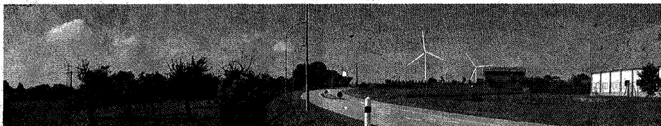
Les éoliennes vues de la ZA de Beaumont (photomontage)

Pourtant, les premiers contacts avec la mairie de Croisilles remontent à 2014 et le conseil municipal