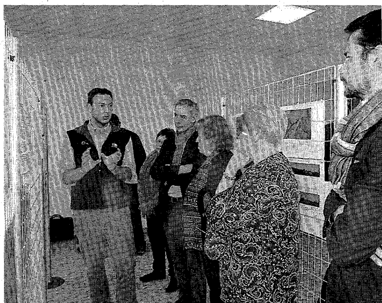
Le projet a été présenté aux élus du territoire, samedi.

Le projet éolien comprend deux éoliennes dont le mât mesure moins de 50 mètres nacelle incluse (45 mètres au moyen) pour une puissance totale installée de moins de 20 MW (3 MW). Ce projet est donc soumis au régime de déclaration au titre des ICPE. La procédure suppose la rédaction d'un dossier de déclaration. Le coût du projet est estimé à 2,8 millions d'euros, avec un retour sur investissement avant impôt en 12 ans, et une rentabilité de 7 % sur 20 ans. Après dépôt du permis de construire, dans le courant 2018, les porteurs du projet espèrent un début d'exploita-